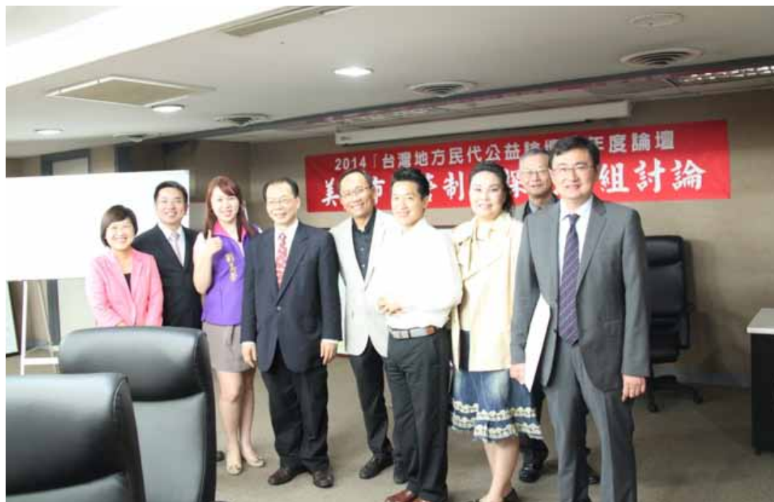
分組論壇會後與會人員合影留念。