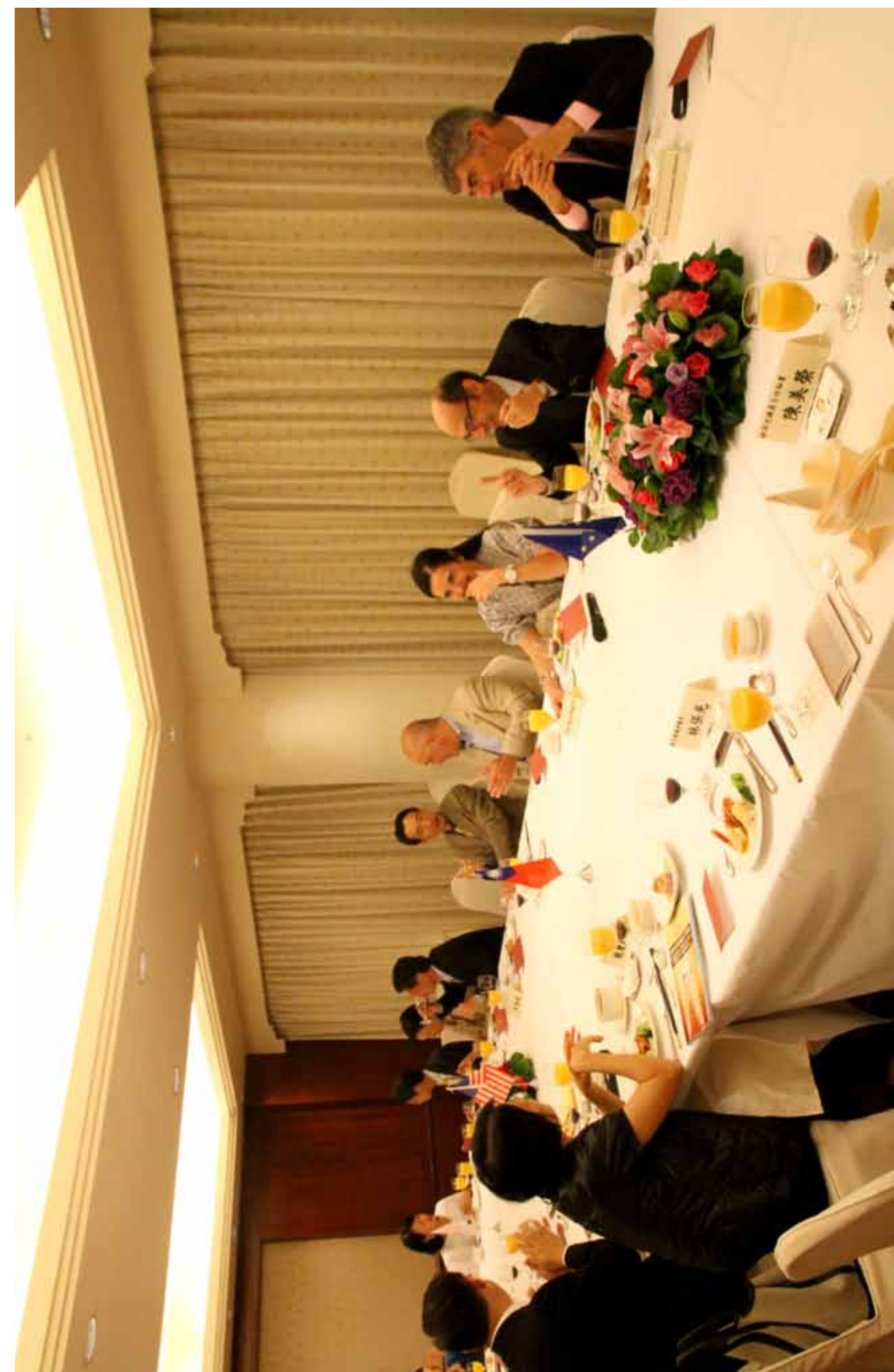
歐、美、日國外貴賓，參加2014「台灣地方民代公益論壇」年度論壇歡迎晚宴。