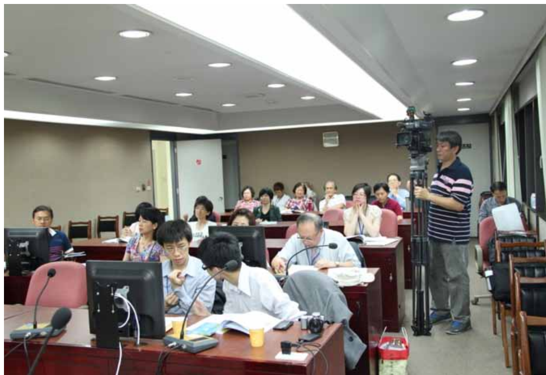
「2014 台灣地方民代公益論壇」年度論壇分組論壇現場。