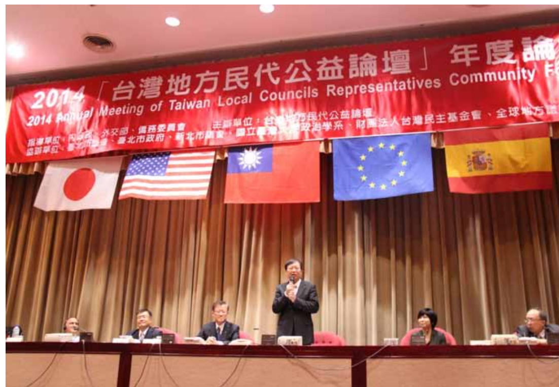
內政部長陳威仁參加「2014 台灣地方民代公益論壇」年度論壇閉幕式。

就，就是把我們國內的議員，也跟我們國內的學界做了一個結合，這個結合可以從兩個方向來看，第一個，台灣地方的民意代表素質學歷水準他在提升了，有很多的民意代表，不只是大學學歷，他也甚至得到碩士跟博士的學歷，所以在這種情況之下，他們對於這種學術的交流，就能夠非常容易接受，這是第一個現象，第二個現象也就是說我們全台灣各大學現在對於這種碩士在職專班他們非常熱烈的推廣，尤其是政治碩士在職專班，像台大蘇老師包老師還有邱老師他們就是這樣子在推動碩士在職專班，結果也讓很多有心的議員，在他們議員任內去從事政治碩士在職專班的訓練，然後他也接觸了學術界，所以今天我們好多位的議員，他們除了本身已經是碩博士之外，也是政治碩士在職專班，甚至開始準備要 Touch，才有這個興趣跟學界接觸。我們在這些碩士在職專班上課的時候，我們就發覺學校的老師對這些擔任議員的學生他們的實務經驗非常重視，希望他們能夠提供給更多的學生去了解到學術跟實務的經驗，但是這些擔任議員的學生，他們也從老師的教導當中，從學術理論來證實他的方向是正確的，所以也因為有這兩點，才讓我們今天能夠有那麼多來自全台灣各地方的議員們都能夠不遠千里，甚至於最遠到台東，最遠到馬祖，都有議員來到這個地方來參與，這是我們台灣的第一步，我覺