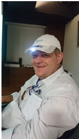
(頭戴大愛科技產品)